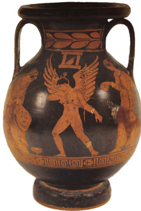
Fig. 1. Pelike apula con Eros tra due donne e trottola; Pittore di Bologna 425; 370-360 a.C. Matera, Museo Nazionale “Domenico Ridola” (rielaborazione da Russo 2002: 70).

Possiamo menzionare, ad esempio, una pelike apula a figure rosse (fig. 1), attribuita al Pittore di Bologna 425 (370-360 a.C.), conservata a Matera (Museo Archeologico Nazionale “Domenico Ridola”). Sulla sinistra della scena si trova una donna seduta, elegantemente vestita e adornata, che guarda con capo chino in direzione di Eros, presente al centro della scena. Il dio alato, nudo e ornato di gioielli, stringe nella mano destra una sferza ( mastix ) pronto a tirare un colpo alla trottola che ruota ai suoi piedi. Alle sue spalle si trova un'altra giovane, intenta al gioco della palla.