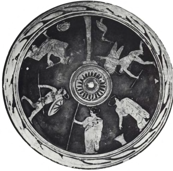
Fig. 2. Coperchio di pisside attico con scena di gineceo; fine V secolo a.C. Atene, Collezione Kanellopoulos (rielaborazione da SCHAUENBURG 1976: 50, fig. 21).