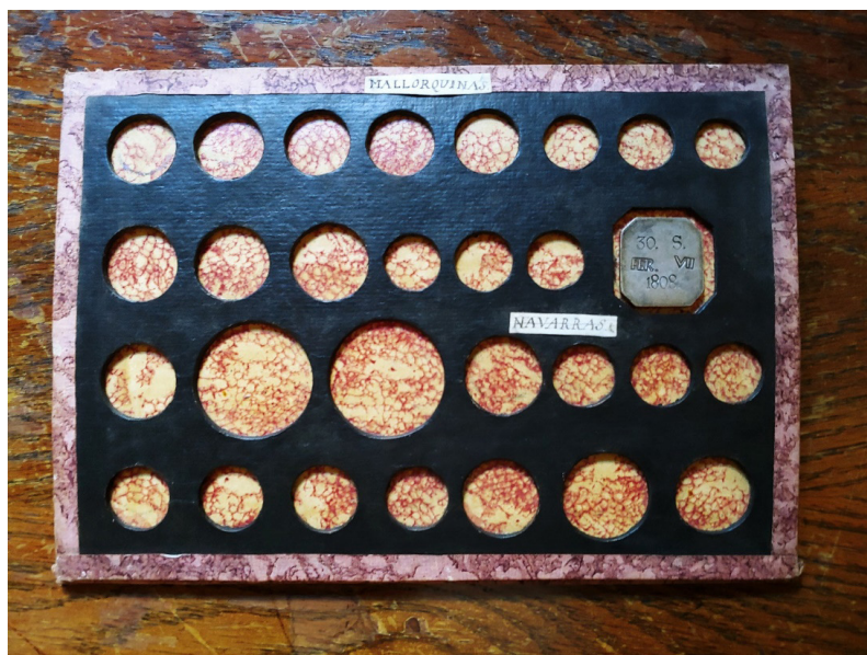
Figg. 2-3. Caja con dos llaves y los 31 monetarios de cartón identificados como los originales de la colección del canónigo Ripoll. Abajo, uno de los cartones con la emblemática moneda de 30 sous de Mallorca a nombre de Fernando VII de 1808 en su lugar (Colección de la Reial Acadèmia de Bones Lletres de Barcelona).