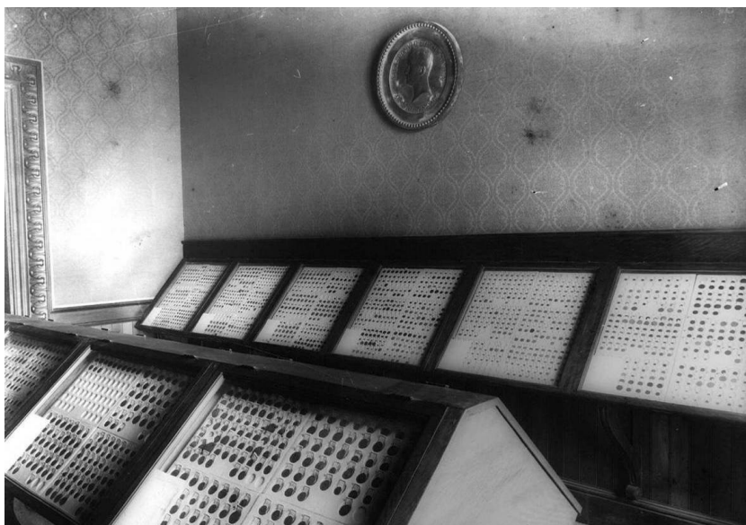
Fig. 12. Sala dedicada a Bosch i Alsina presidida por el medallón con su retrato (Colección del Gabinet Numismàtic de Catalunya, Museu Nacional d'Art de Catalunya, Barcelona).