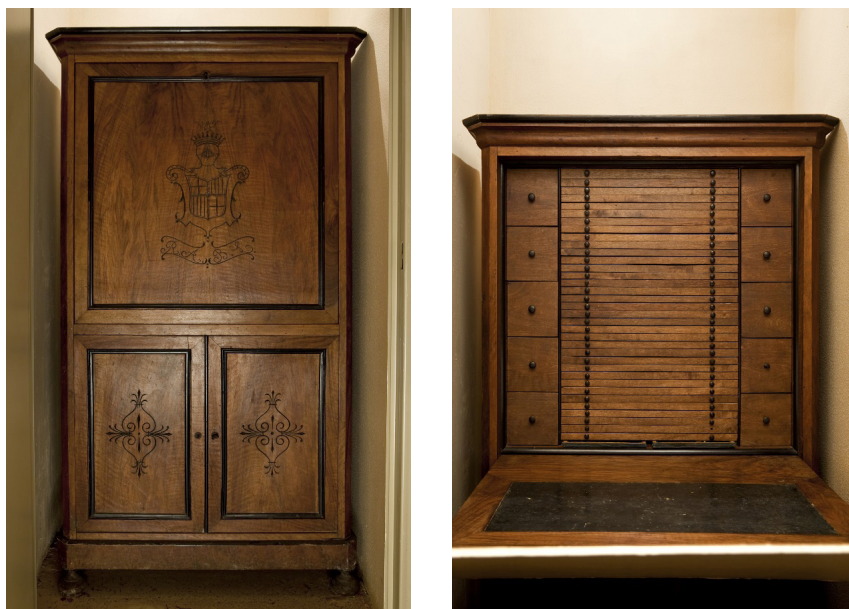
Figg. 9-10. El bureau -monetari de la Reial Acadèmia de Bones Lletres de Barcelona cerrado (izquierda) y abierto (derecha) (Colección de la Reial Acadèmia de Bones Lletres de Barcelona).