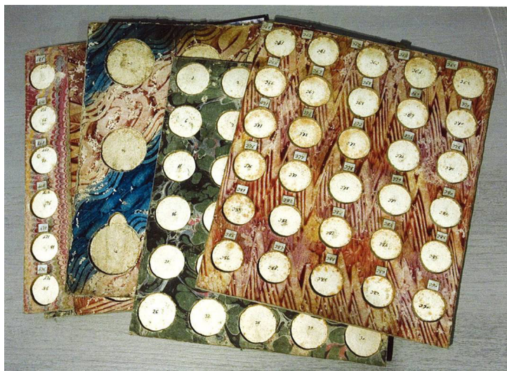
Fig. 1. Cartones del monetario Salvador (Colección del Institut Botànic de Barcelona).

El balance provisional que obtenemos de este repaso es que, en primer lugar, es necesaria una investigación más exhaustiva mientras que, en segundo lugar, podemos destacar la gran variedad de formas y modos de guardar las monedas en las colecciones privadas catalanas del siglo XIX. Esta disparidad contrasta con la disposición en vitrinas inclinadas acristaladas a una o dos vertientes en los museos de la capital y en los locales. La razón de esta diferencia sea, probablemente, la necesidad de exponer las piezas al público bajo el principio general común de presentar todas las piezas a la vista. Este principio de publicidad contrastaba con el de sigilo del gabinete numismático particular. En este, la presentación de las piezas era excepcionalmente a grupos reducidos de entendidos.