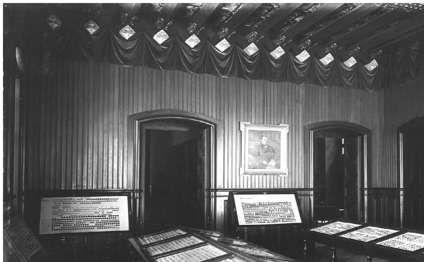
Fig. 11. Sala dedicada a Francesc Esteve i Sans presidida por su retrato (Colección del Gabinet Numismàtic de Catalunya, Museu Nacional d'Art de Catalunya, Barcelona).